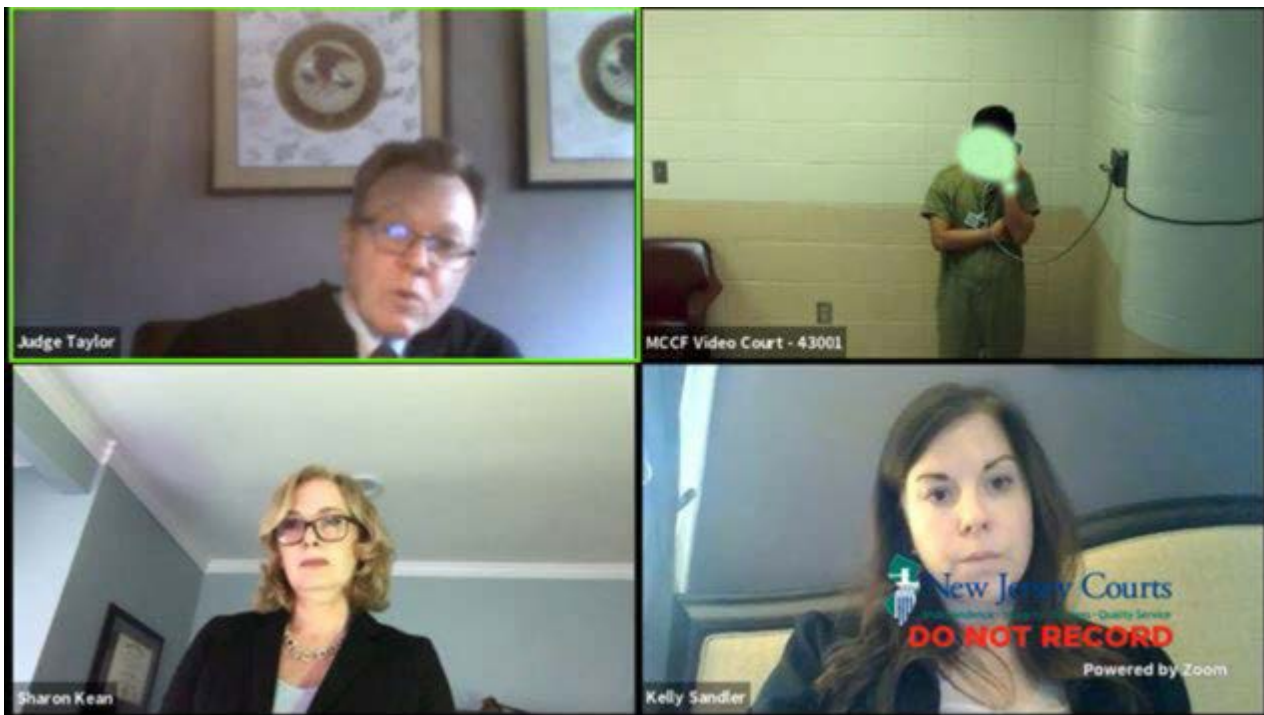
El Juez Stephen Taylor del Tribunal Superior preside durante un pedimento para volver a abrir la detención en el Condado de Morris el 13 de abril de 2020.